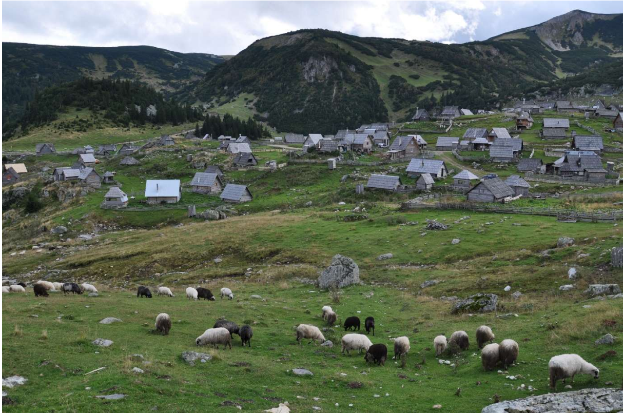
Foto: Alm in Bosnien

soziale Gerechtigkeit zu fördern und nachhaltige Entwicklung voranzutreiben. Die Projekte werden von der Caritas umgesetzt. Die wissenschaftliche Qualitätssicherung übernimmt die Universität für Bodenkultur Wien (BOKU), die alle Projekte mit fundierter Forschung begleitet und prüft. Das Projekt unserer Wahl ist " Saubere Energie und Ernährungssicherheit in Norduganda ".