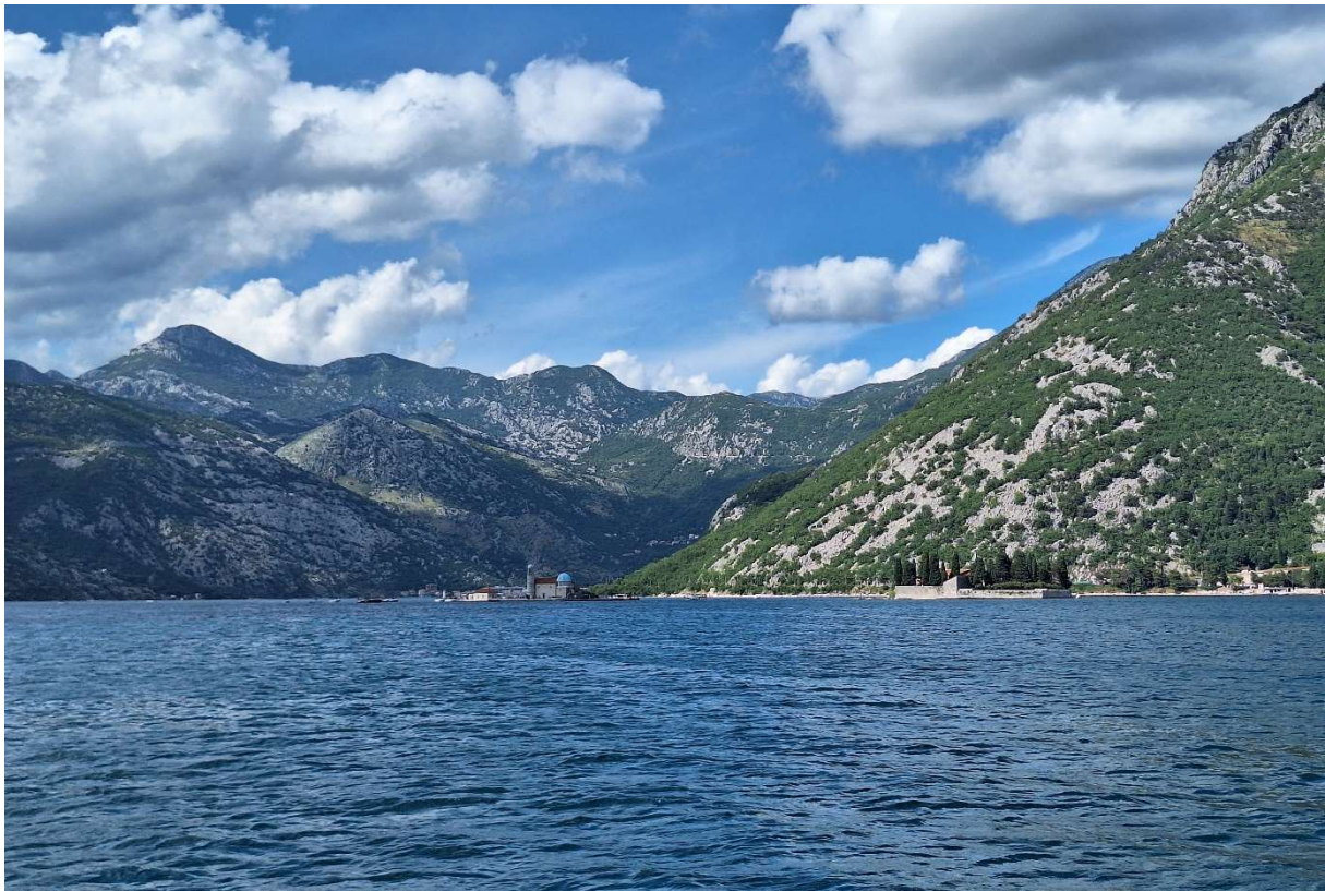
Bucht von Kotor, Montenegro

Wir freuen uns sehr, dass uns viele Reisende auf unserem Weg begleiten und unsere engagierten Reisebegleiter:innen die Botschaft von WELTANSCHAUEN weitertragen.