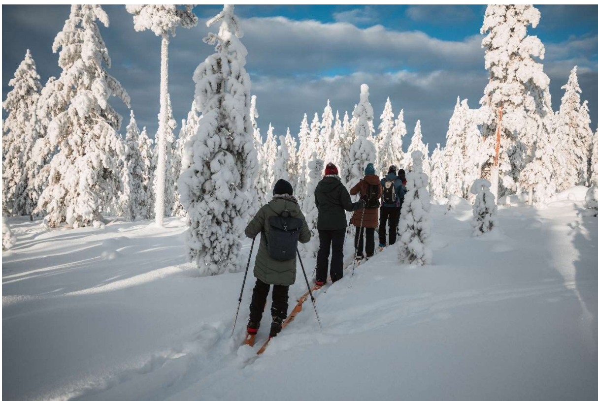
Schitour im Wildnisdorf, Schweden

Nachhaltigkeit steht bei WELTANSCHAUEN für eine umfassende ökologische, soziale und wirtschaftlich zukunftsfähige Entwicklung. Der Konsum nachhaltig produzierter Lebensmittel, die Nutzung erneuerbarer Energien oder die Verwendung von Produkten aus fairen Produktionsverhältnissen vermindern den globalen Hunger und die Klimakatastrophe und entsprechen daher dem Handeln, das es in einer sozialen und gerechten Welt braucht. Daher ist es uns wichtig, Rohstoffe (Strom, Wasser, Material) sparsam und umweltbewusst zu gebrauchen, unsere Mobilität so klimaschonend wie nur möglich zu gestalten und ökologisch und sozial nachhaltige Aspekte in die Entscheidungsprozesse mit einzubeziehen. WELTANSCHAUEN motiviert Mitarbeiter:innen, Lieferant:innen und Kund:innen, sich an diesem Prozess zu beteiligen.