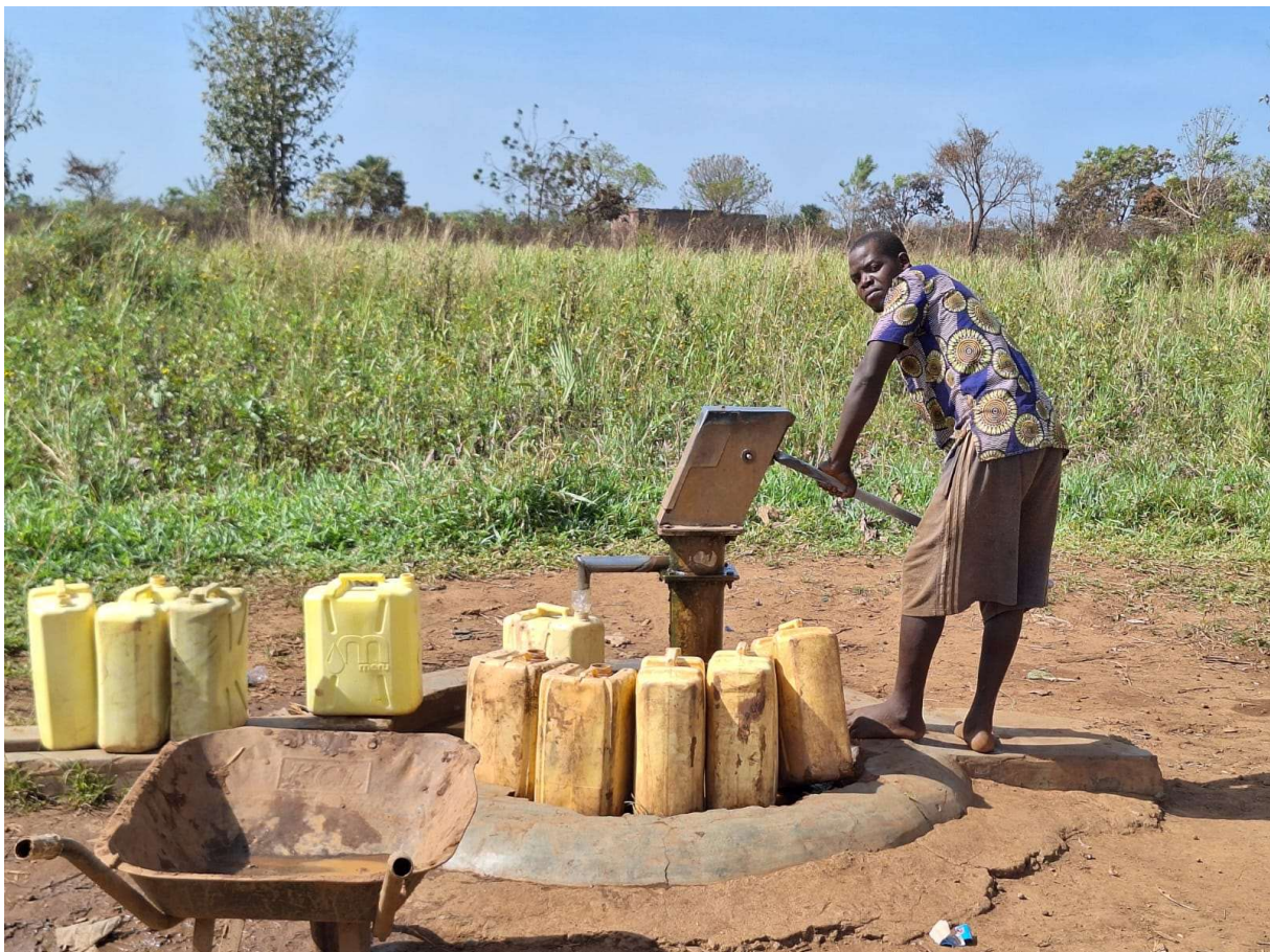
Foto: Green Energy and Nutrition, Biogasanlage, Gulu, Uganda, Christoph Müllerder

Keine andere Art der Fortbewegung verbrennt so viel Energie wie das Fliegen. Heute schon ist der Luftverkehr weltweit für fünf Prozent der globalen Erwärmung verantwortlich und wächst jedes Jahr um vier bis fünf Prozent (Quelle: Bund für Umwelt und Naturschutz Deutschland (BUND) ). Wir legen uns daher selbst die Verpflichtung auf, maximal 10 % unserer Reisen als Flugreisen anzubieten. Das sind ausschließlich Fernreisen, die wir durchführen, weil wir auch den Blick über den europäischen Tellerrand und interkulturelles Lernen ermöglichen wollen. In Europa reisen wir nur auf dem Landweg.